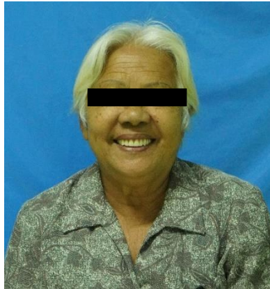
รูปที่ 3 แสดงภาพผู้ป่วยขณะยิ้มหลังใส่ฟันเทียม

ครั้งที่ 6-9: ติดตามผลภายหลังการใส่ 2 วัน, 3 สัปดาห์, 1 เดือน และ 6 เดือน เพื่อทำการกรอแก้ไข ให้คำแนะนำการใช้งานและการดูแลรักษาฟันเทียม จนกระทั่งผู้ป่วยไม่มีปัญหาใด ๆ มีความพึงพอใจมาก เนื่องจากฟันเทียมมีการยึดอยู่ที่ดี ใช้นัดเคี้ยวอาหารได้ดีและไม่มีเศษอาหารค้างที่กระพุ้งแก้ม รูปหน้าดูดี สามารถพูดคุยและใช้งานได้อย่างมั่นใจ ตรวจช่องปากพบว่าเนื้อเยื่อเหงือกมีสีชมพู ไม่พบแผลหรือสิ่งผิดปกติใด ๆ บริเวณสันเหงือก สามารถรักษาความสะอาดฟันเทียมและรักษาความสะอาดในช่องปากได้ดี