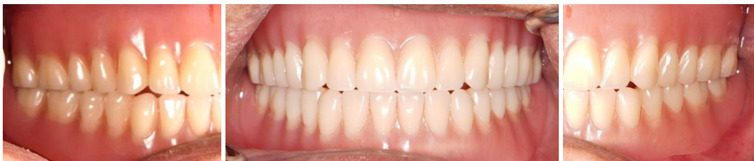
รูปที่ 2 แสดงการใส่ฟันเทียมบนและล่างในปากผู้ป่วย

ครั้งที่ 5: ใส่ฟันเทียมในปากผู้ป่วย ประเมินขอบโดยรวม การฉีกบริเวณขอบ แรงแยัด คุณค่าด้านความงาม ปรับแต่งฐานฟันเทียมด้านที่แนบเนื้อเยื่อให้เป็นไปตามที่คาดหวังไว้ โดยใช้ครีมนวดจุดกด แก๊ซการสบคลาดเคลื่อนจนได้การสบฟันตามแผนการรักษา แนะนำการใช้งาน และให้ผู้ป่วยกลับมาพบทันตแพทย์ในระยะเวลาตามที่นัดหมาย